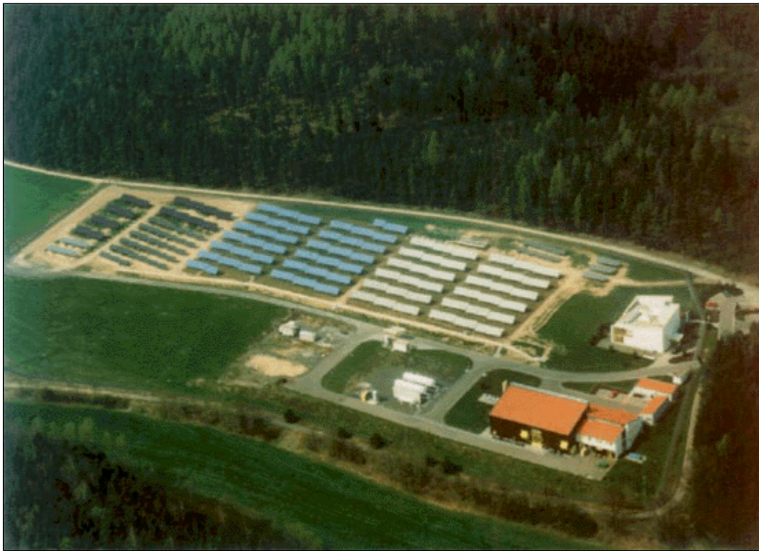
Abb. 2: Bertram-Luftbild Gesamtanlage vom 23.04.1994

Einen optischen Eindruck der Gesamtanlage vermittelt ein Luftbild (Abb. 2), auf dem das Gelände, das Betriebs- und Mehrzweckgebäude sowie die im Freien installierten Anlagenteilsysteme zu erkennen sind. Dazu gehören die zum Zeitpunkt der Aufnahme noch teilweise in der Montage befindlichen Solarfelder, das Gaslager und die LH 2 -Tankstelle.